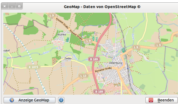
Abbildung 18.0.3.5.3: Projekt GeoMap

Im Projekt GeoMap → Kapitel 17.15.1 werden die Intentionen zum Beispiel 5 praktisch umgesetzt: