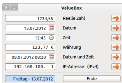
Abbildung 16.1.1: Sechs Label in Aktion

Mit einem Label können Sie bezeichnenden Text anzeigen. Daher ist auch die Eigenschaft Label.Text die wichtigste. Für das Programm ValueBox zum Beispiel wurden sechs Label benutzt, um eine Beschreibung für den Inhalt der sechs ValueBoxen anzuzeigen: