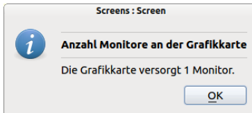
Abbildung 20.16.1: Anzeige der Anzahl von Monitoren an der Grafikkarte

Die Klasse Screens besitzt nur eine Eigenschaft. Mit Screens.Count wird die Anzahl der Monitore zurückgegeben, die mit der Grafikkarte Ihres Systems verbunden sind.