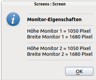
Abbildung 20.16.3: Anzeige ausgewählter Monitor-Eigenschaften für mehrere Monitore