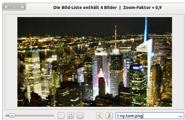
Abbildung 17.18.1: Bildanzeige in einer ImageView

Die Komponente ImageView ( gb.form ) implementiert einen Bild-Betrachter.