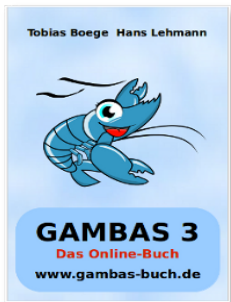
Abbildung 1.1.2.3: Online-Buch-Cover

Unter http://gambasdoc.org/help/doc/book?en&view finden Sie einige Bücher für ältere Gambas-Versionen und auch ein Online-Buch für Gambas 3: