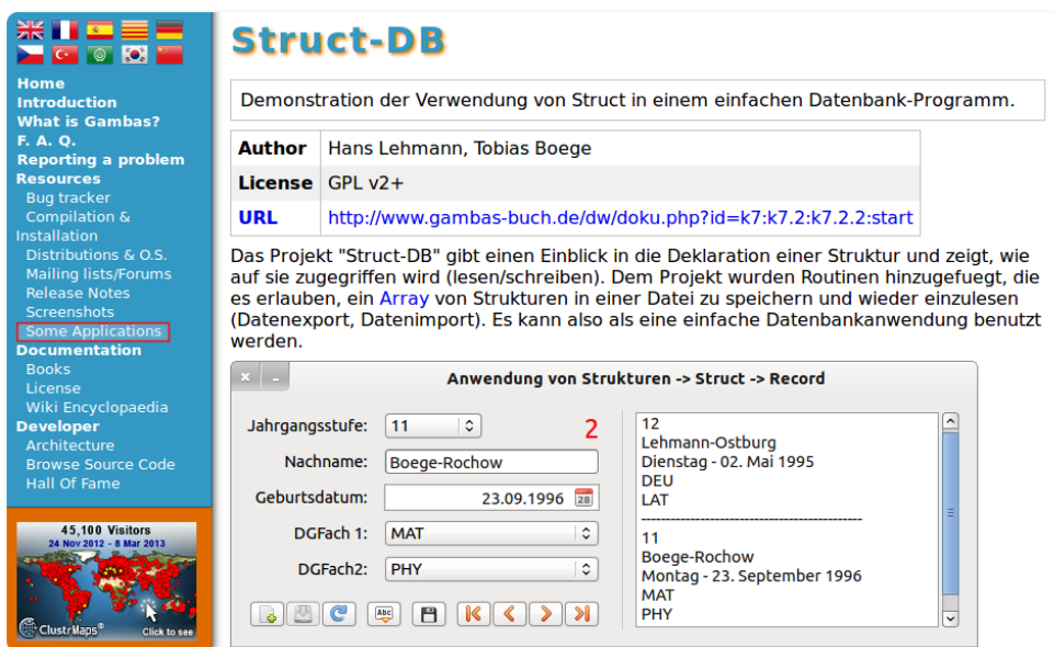
Abbildung 1.1.2.4: Projekt 'Struct' auf der Seite 'Anwendungen'

Sehr informativ ist die Übersicht auf der Startseite von http://gambas.sourceforge.net/en/main.html zu Gambas-Projekten, die aus unterschiedlichen Einsatzgebieten zusammengestellt wurde. Oft stellen die Entwickler nicht nur das Programm unter einer angegebenen Lizenz zur Verfügung, sondern auch das vollständige Gambas-Projekt – inklusive aller Quelltexte. Die Autoren haben auch ein Projekt zum Thema 'Daten-Typ Struct' zum Download bereit gestellt: